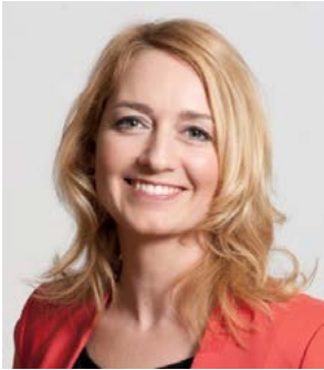
Caren Lay Stellvertretende Fraktionsvorsitzende, Sprecherin für Mieten-, Bau und Wohnungspolitik der Fraktion DIE LINKE

Doch gute Ideen und Vorschläge alleine genügen nicht. Um neue politische Mehrheiten für eine soziale Wohnungspolitik zu bilden, braucht es die Zusammenarbeit mit den stadt- und mietenpolitischen Initiativen. Wo noch keine Kontakte zwischen LINKEN Stadt- und Gemeinderät*innen mit der organisierten Zivilgesellschaft bestehen, sollten sie geknüpft und ausgebaut werden. Denn gegen unbewegliche Mehrheiten und den Einfluss der Bau- und Immobilienlobby hilft nur politischer Druck. Nur so kann die wohnungspolitische Wende gelingen - und die ist dringend nötig!